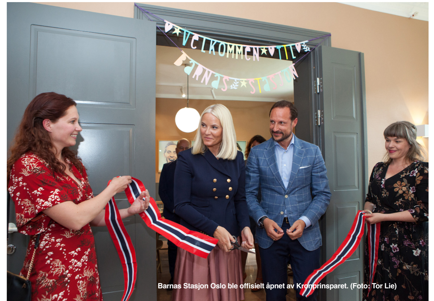
Barnas Stasjon Oslo ble offisielt åpnet av Kronprinsparet.