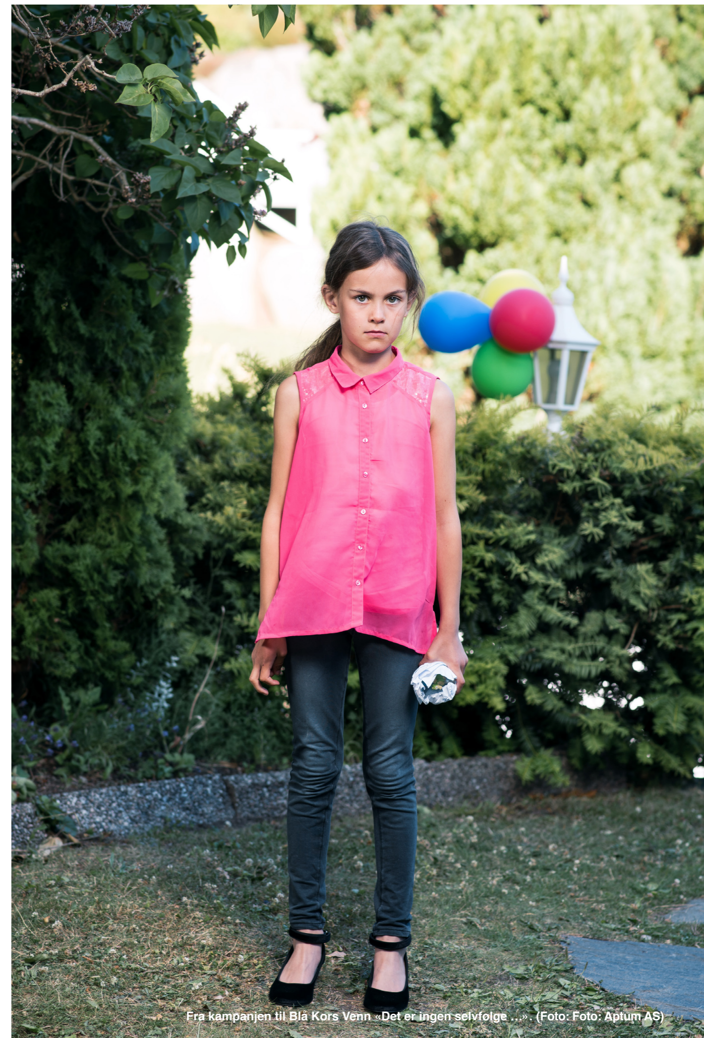
Fra kampanjen til Blå Kors Venn «Det er ingen selvfølge ...»

Det mest grunnleggende i fundamentet for langsiktig fundraisingarbeid er således lagt, og Blå Kors hovedkontor fortsetter den positive utviklingen i tett samarbeid med divisjonene, foreninger og stiftelser.