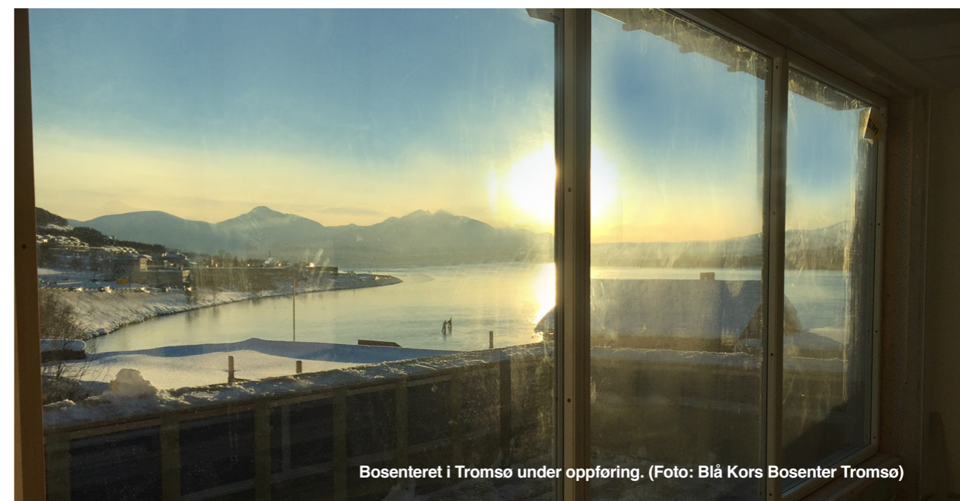
Bosenteret i Tromsø under oppføring.

Avtalen med Ålesund kommune om drift av 14 boenheter og fem natthjemsplasser er revidert i 2017. Avtalens varighet er fram til august 2025, og kan fornyes for ytterligere fem år ad gangen.