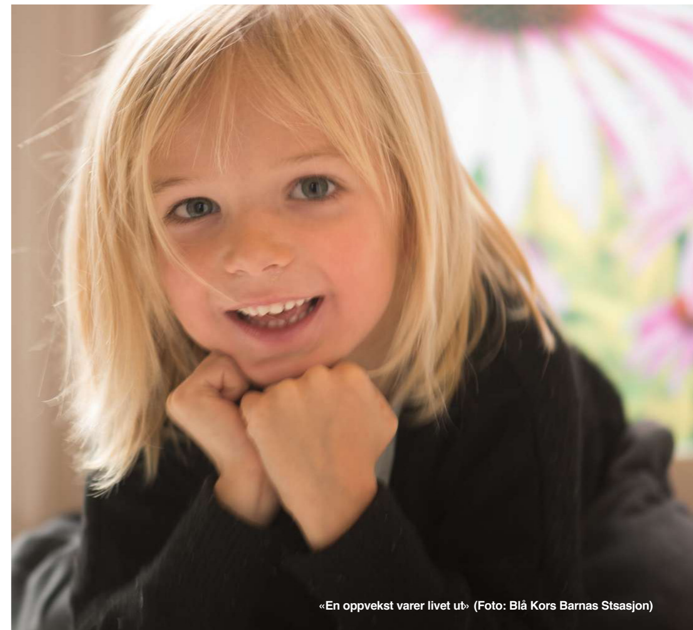
«En oppvekst varer livet ut»

I Blå Kors Barnas Stasjon får hele familien også gode opplevelser gjennom ferie- og fritidsaktiviteter, lek og hygge. I tillegg kan foreldrene få hjelp gjennom grupper, samtaler og veiledning. Det kreves ingen henvisning for å benytte tilbudet.